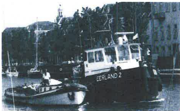
Juni 1989: de "Jan van der Heyde" verlaat Hellevoetsluis en vertrekt richting Rotterdam.

De voormalige Amsterdamse motorbrandblusboot "Jan van der Heyde" heeft in twee jaar tijds in de Rotterdamse Oude Haven een algemene opknappbeurt ondergaan: Het casco werd gestraald en opnieuw geschilderd; de motoren, keerkoppelingen en bluspompen werden geheel gereviseerd; het elektrische systeem werd vervangen door een nieuw en aan de huidige eisen en normen voldoende systeem; de roefbelimpering werd vrijwel geheel gerestaureerd in de oude staat en tenslotte werd het oude dek vervangen door een nieuw teakhouten dek van bijna vijf centimeter dik. De "Jan" werd vrijdag 28 juni 1991 in de Oude Haven te Rotterdam feestelijk opnieuw in gebruik genomen door erespuitgast mr P. Blussé van Oud Alblas.