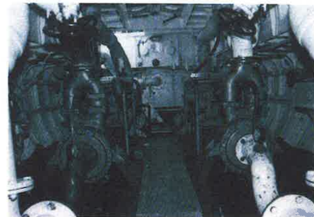
Machinekamer: op de voorgrond beide "Amag-Hilpert" pompen met daarachter beide DAF-scheepsdiesels.

Op 24 april 1990 werd de "Jan van der Heyde" door het brandweermuseum voor (voorlopig) twaalf jaar in permanente bruikleen overgedragen aan de Stichting Blusboot Jan van der Heyde. Deze stichting werd speciaal in het leven geroepen om de boot weer helemaal te restaureren en daarna in de vaart te houden als nationaal brandweermuseum. Met de door deze stichting bijeengebrachte middelen werd de blusboot in oude glorie hersteld. Vlak voor de geplande presentatie kwam de "Jan" door een noodlottig ongeval op 17 oktober 1990 in de Oude Haven te Rotterdam tot zinken. De volgende morgen reeds werd het schip gelicht. Desondanks was er verschrikkelijk veel schade en moest een heleboel van het reeds uitgevoerde werk opnieuw worden gedaan.