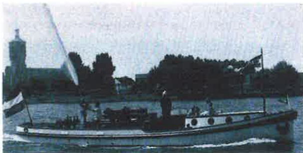
De "Jan van der Heyde" kort na zijn restauratie tijdens een optreden bij Dordrecht, juli 1991.

Natuurlijk zijn incidentele bijdragen ook altijd bijzonder welkom!