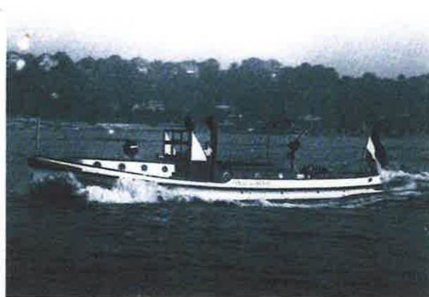
De gloednieuwe "Jan" tijdens de proefvaart bij Hamburg in 1930.

In 1983 werd de "Jan van der Heyde" 'van de sterkte afgevoerd' en met pensioen gestuurd. De boot ging voor het symbolische bedrag van één gulden over in eigendom aan de Stichting Nationaal Brandweermuseum te Hellevoetsluis.